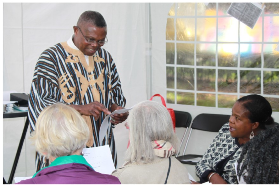
Ook konden belangstellenden een workshop drum en een taallessen in de Ghanese taal Twi volgen.

In september 2015 bestonden we 5 jaar. Dat is op het grasveld achter de flat gevierd met een dankdienst, een maaltijd, toespraken van het bestuur, een bestuurslid van de SMA, Dokters van de Wereld, de voorzitter van de bestuurscommissie van het Stadsdeel Zuidoost, twee bezoekers, de oudste lesgeefster en van de hulpbisschop van Haarlem-Amsterdam. Er was een Nederlandse taallessen. De bezoekers konden via een tentoonstelling en een modeshow